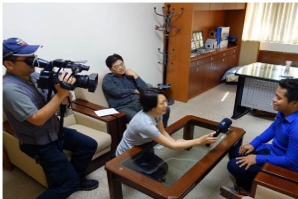
物理系博士生接受媒體訪問