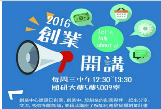
3 月 9 日起每周三中午 12:30~13:30 國研大樓創業中心創業開講活動