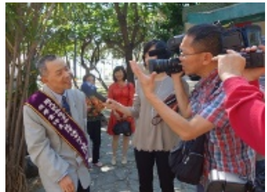
亞太所博士生接受媒體訪問